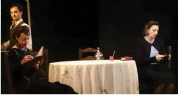
El Grupo Mester vuelve a Tortuguitas con la obra "Brandsen".